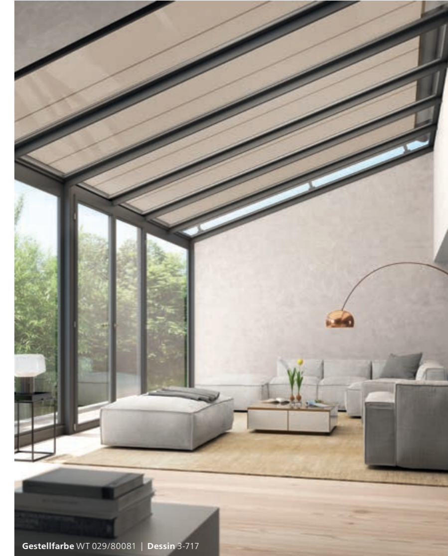
Gestellfarbe WT 029/80081 | Dessin 3-717