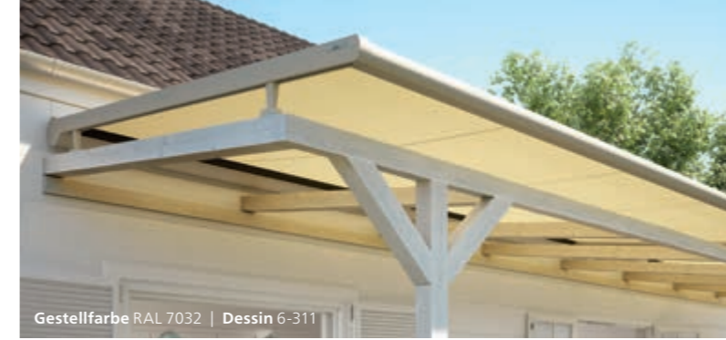
Gestellfarbe RAL 7032 | Dessin 6-311

... und natürlich auch für das weinor Terrassendach Terrazza