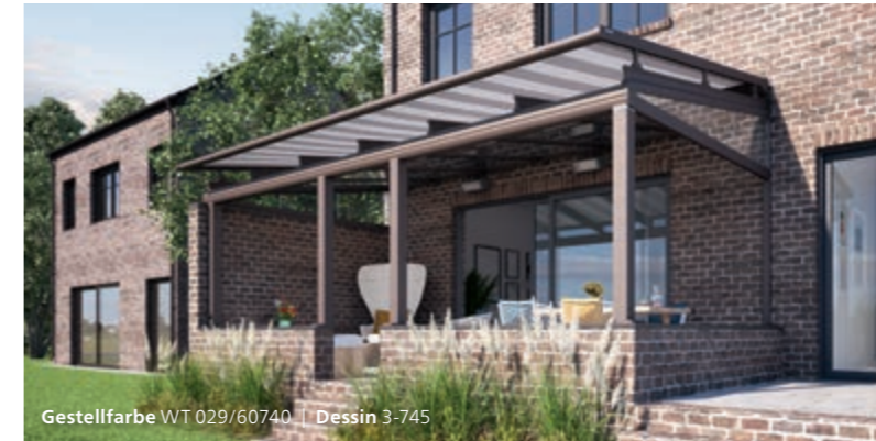
Gestellfarbe WT 029/60740 | Dessin 3-745

Die Markisenkonstruktion lässt sich auch für ins Haus integrierte Wintergärten einsetzen