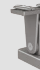
Stützfuß top für Reihenanlagen, verstellbar, in 3 Höhen: 120–165, 165–210 und 210–255 mm