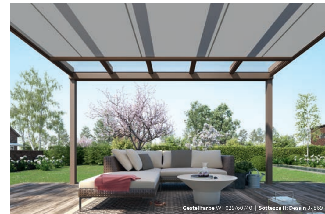
Gestellfarbe WT 029/60740 | Sottezza II: Dessin 3-869

Bei Terrazza Pure VertiPlus ist die eckige Kassette der Senkrecht-Markise so clever in das Glas-Terrassendach integriert, dass keine Übergänge, Kanten oder Aufsätze zu sehen sind. Alles ist perfekt aufeinander abgestimmt – technisch und optisch.*