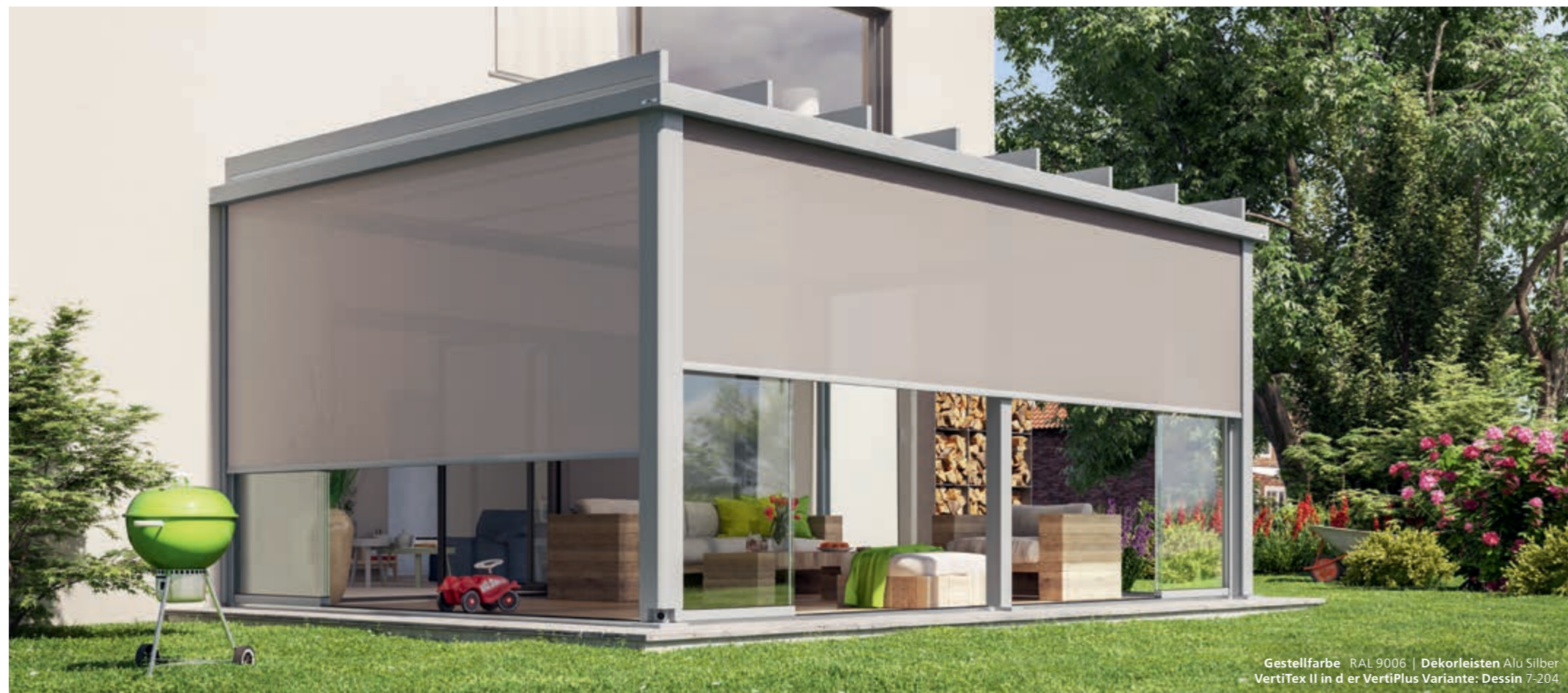
Gestellfarbe RAL 9006 | Dekorleisten Alu Silber VertiTex II in der VertiPlus Variante: Dessin 7-204

Sie möchten von den Seiten und von vorne vor Blicken und blendendem Licht geschützt sein? Dann ist die Senkrecht-Markise VertiTex II von weinor die richtige Wahl. Die speziell für VertiTex II entwickelte Kollektion screens by weinor® umfasst eine große Auswahl an hochwertigen Tüchern. Und das patentierte weinor Opti-Flow-System® gewährleistet einen optimalen Tuchstand. VertiTex II für Terrazza Pure gibt es auch in der optisch attraktiven VertiPlus Variante mit Design-Blenden.*